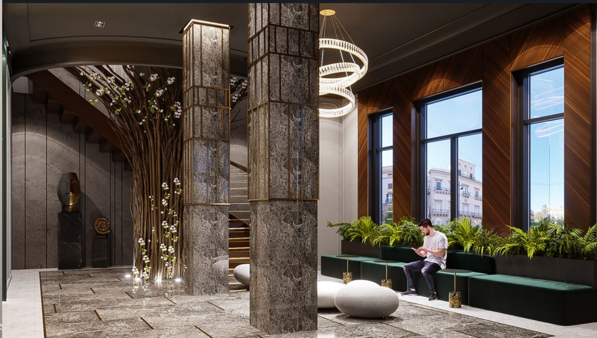
В холле запланированы зоны для деловых и личных встреч.